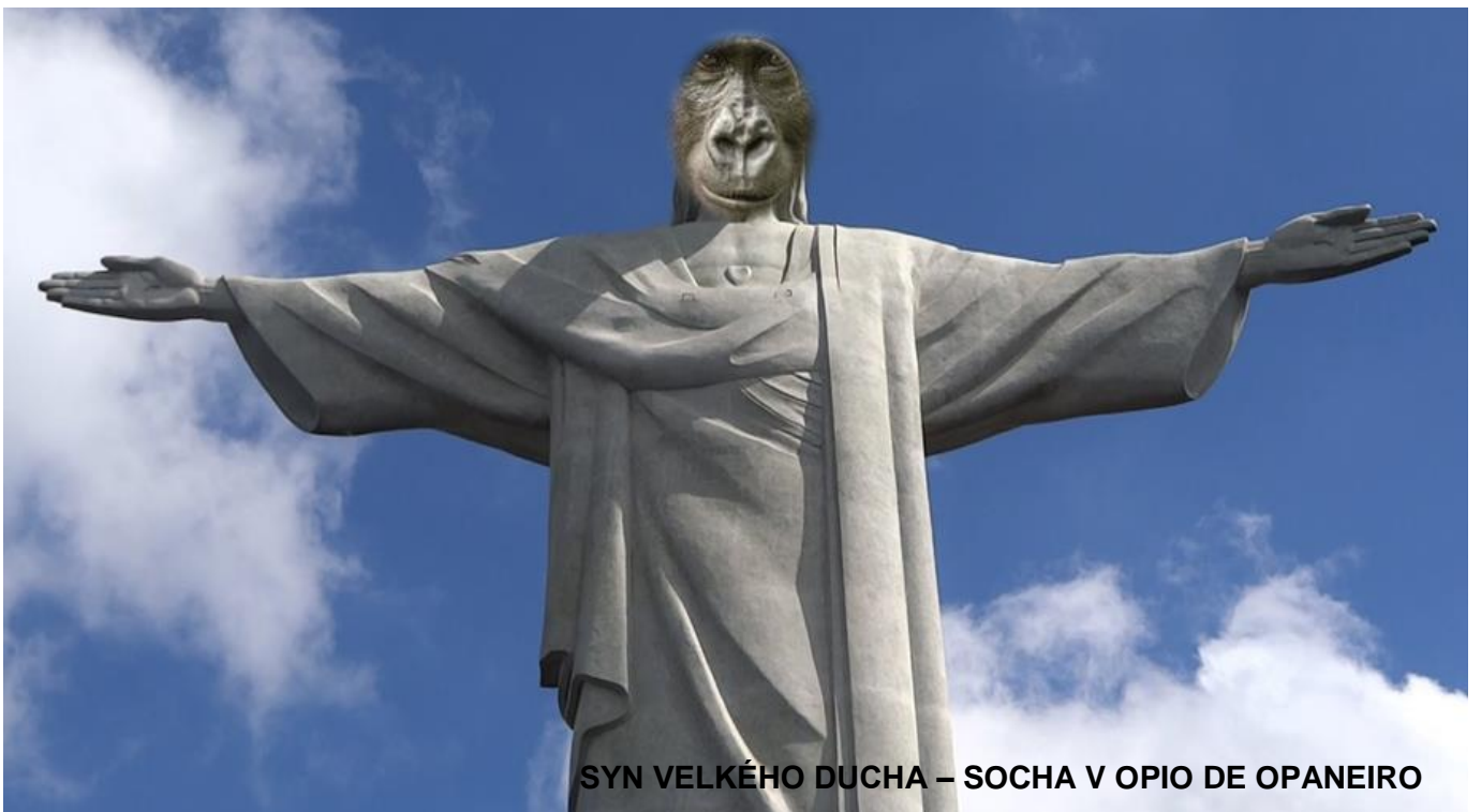
SYN VELKÉHO DUCHA – SOCHA V OPIO DE OPANEIRO

Krásné divadelní hry, hudební díla, krásné obrazy, pěkná, originální sousoší a sochy, opery, balety, stavby, objevy a vynálezy a další a další skutečnosti z historie jen ukazují, jak vyspělá Planeta opic je, jak moudré, vzdělané, kreativní a originální historické opičí osobnosti nás předešly a jsou nám vzorem.