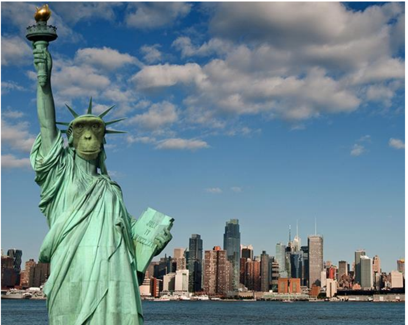
SOCHA POSLUŠNOSTI V APE TOWNU

dán právoplatně vzdělanými a politiky schválenými vědci. Kdo by toto nerespektoval, hrozí mu trest nejvyšší!!!