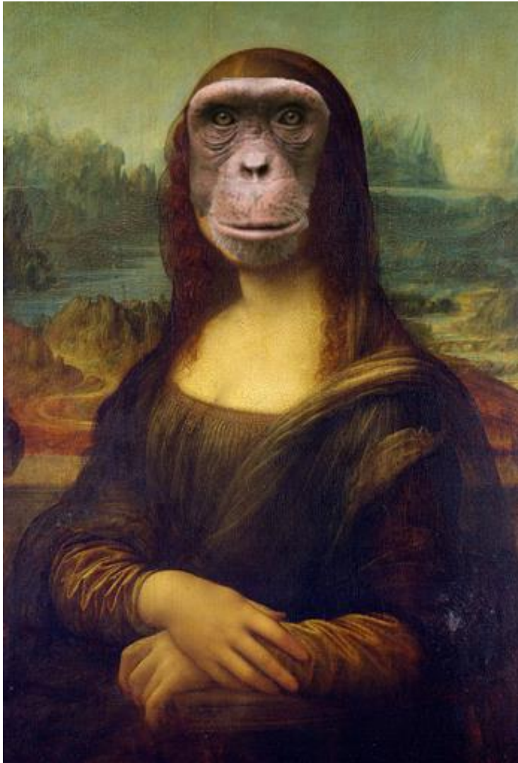
MONA ŠIMPANZÍNA BY APENARDO OP INČI